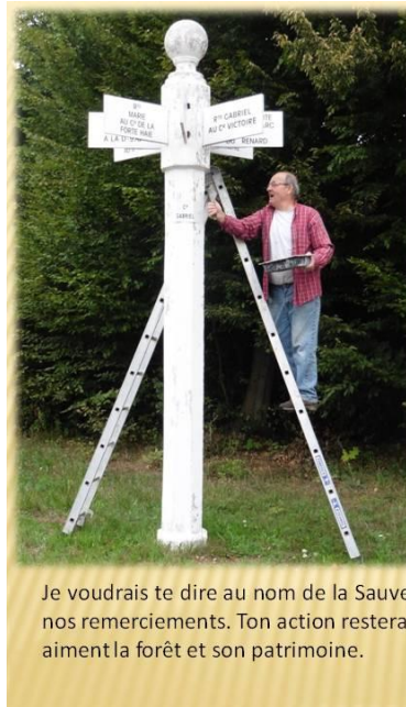
A Jean-Louis Carré

Durant treize années tu as effectué un travail intense avec Didier Dumay pour les poteaux des forêts du Compiégnois.